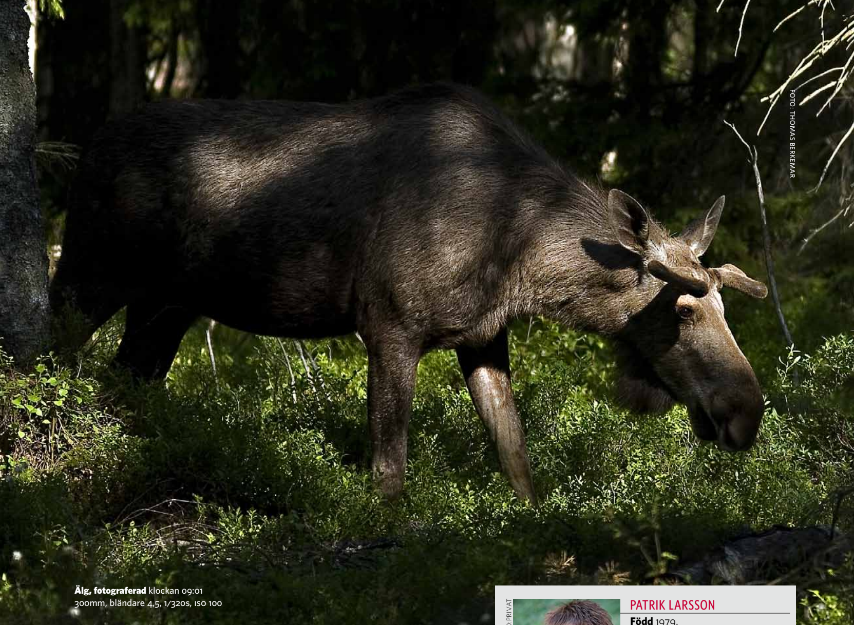
Älg, fotograferad klockan 09:01 300mm, bländare 4,5, 1/320s, ISO 100

skuggor och motivet plattades ut. Med ficklampan kan jag styra ljuset så att insektens skugga faller där jag vill ha den. Eller så håller jag ringblixten snett ovanför insekten, vilket också ger lite skugga. För att framhäva ögon och antenner är det viktigt att detaljstyra ljuset.