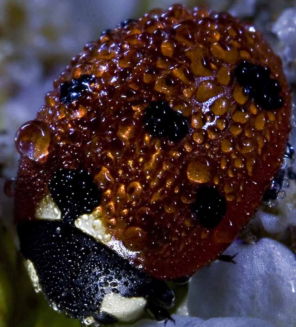
7-prickig nyckelpiga , fotograferad klockan 04:36 100mm, bländare 14,0, 6s, iso 100

När du fotograferat en insekt kan det vara intressant att ta reda på vilken art den tillhör. Efter några år har du en riktigt imponerande bildsamling att visa upp.