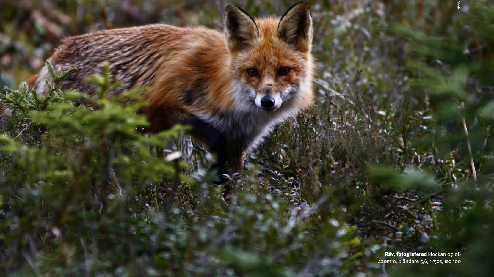
Räv, fotograferad klockan 09:08 420mm, bländare 5,6, 1/50s, ISO 100