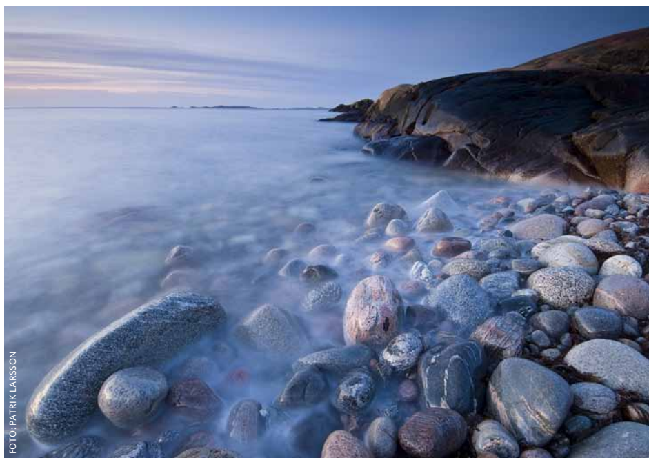
Saltö, Strömstad, fotograferad i december klockan 08:35 12mm, bländare 16,0, 20s, ISO 100

– När solen går upp har man någon futtig timme på sig att fotografera, säger Patrik Larsson. Då är ljuset mjukt och eftersom solen står lågt på himlen blir skuggorna långa och intressanta. Det är den där första timmen på morgonen