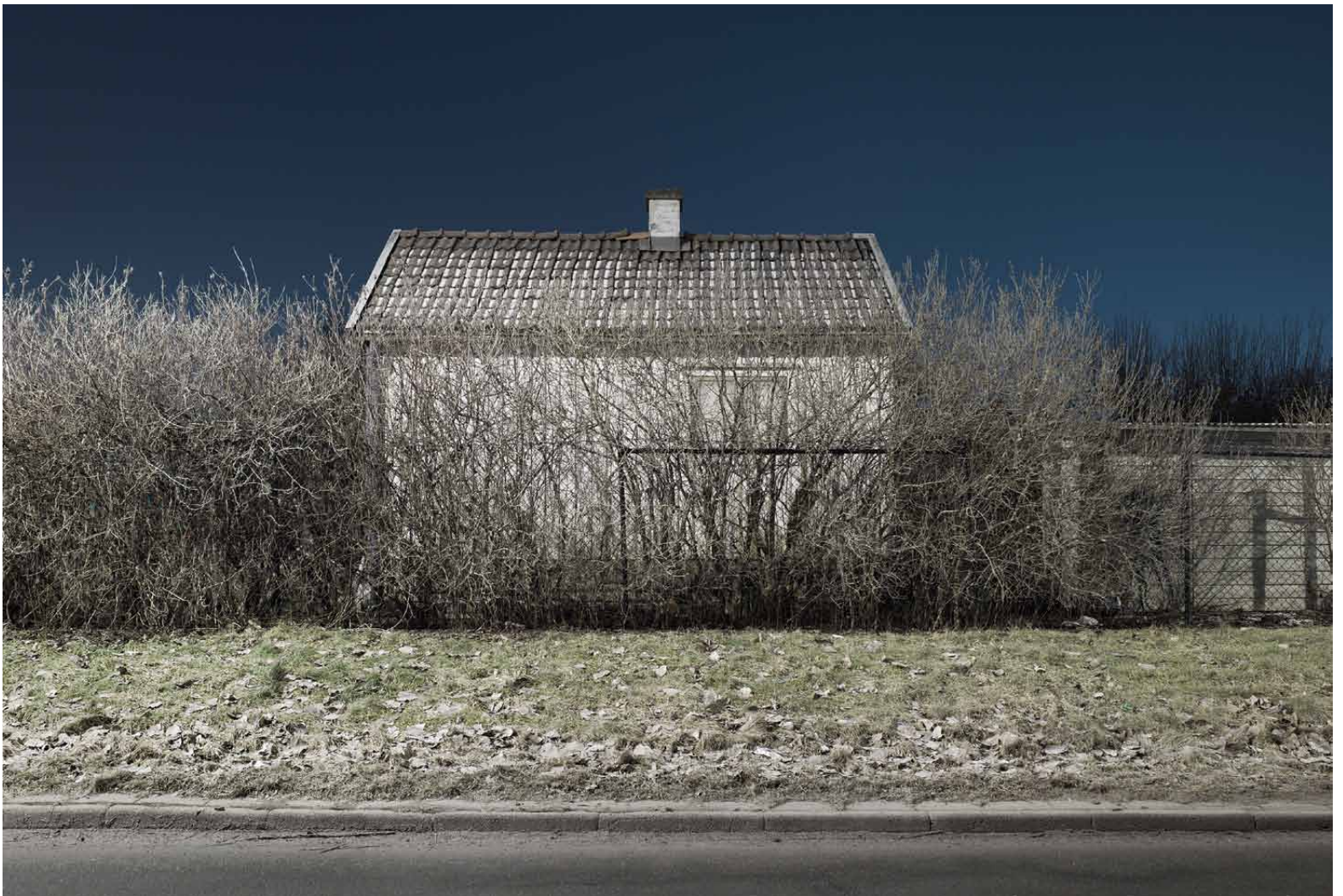
↑Från bildserien Numbers , 2009. ↓Från bildserien Cars , 2007.