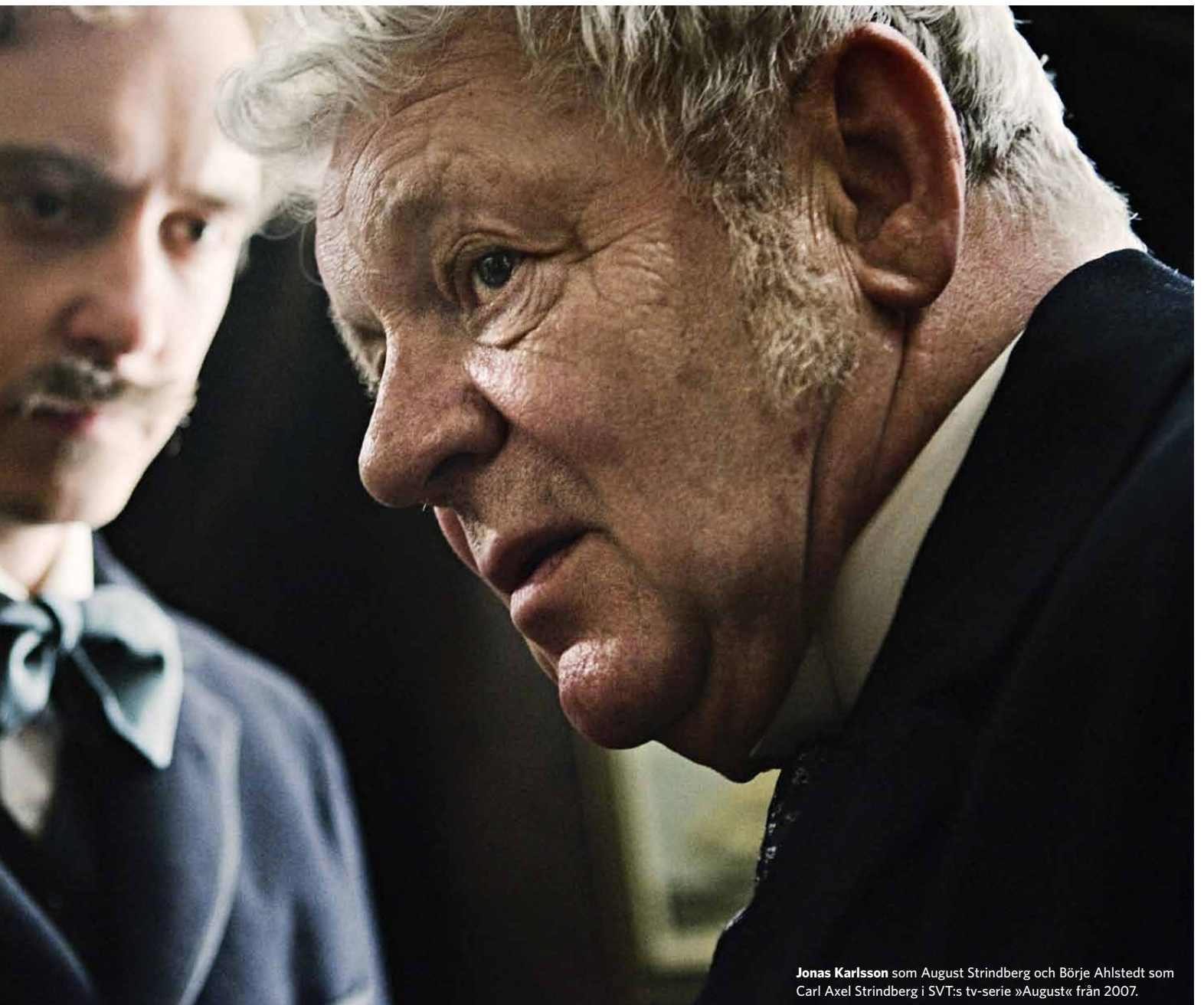
Jonas Karlsson som August Strindberg och Börje Ahlstedt som Carl Axel Strindberg i SVT:s tv-serie »August« från 2007.

Alla sliter när en film blir till. Dagarna är långa, nätterna likaså. Det är kallt.