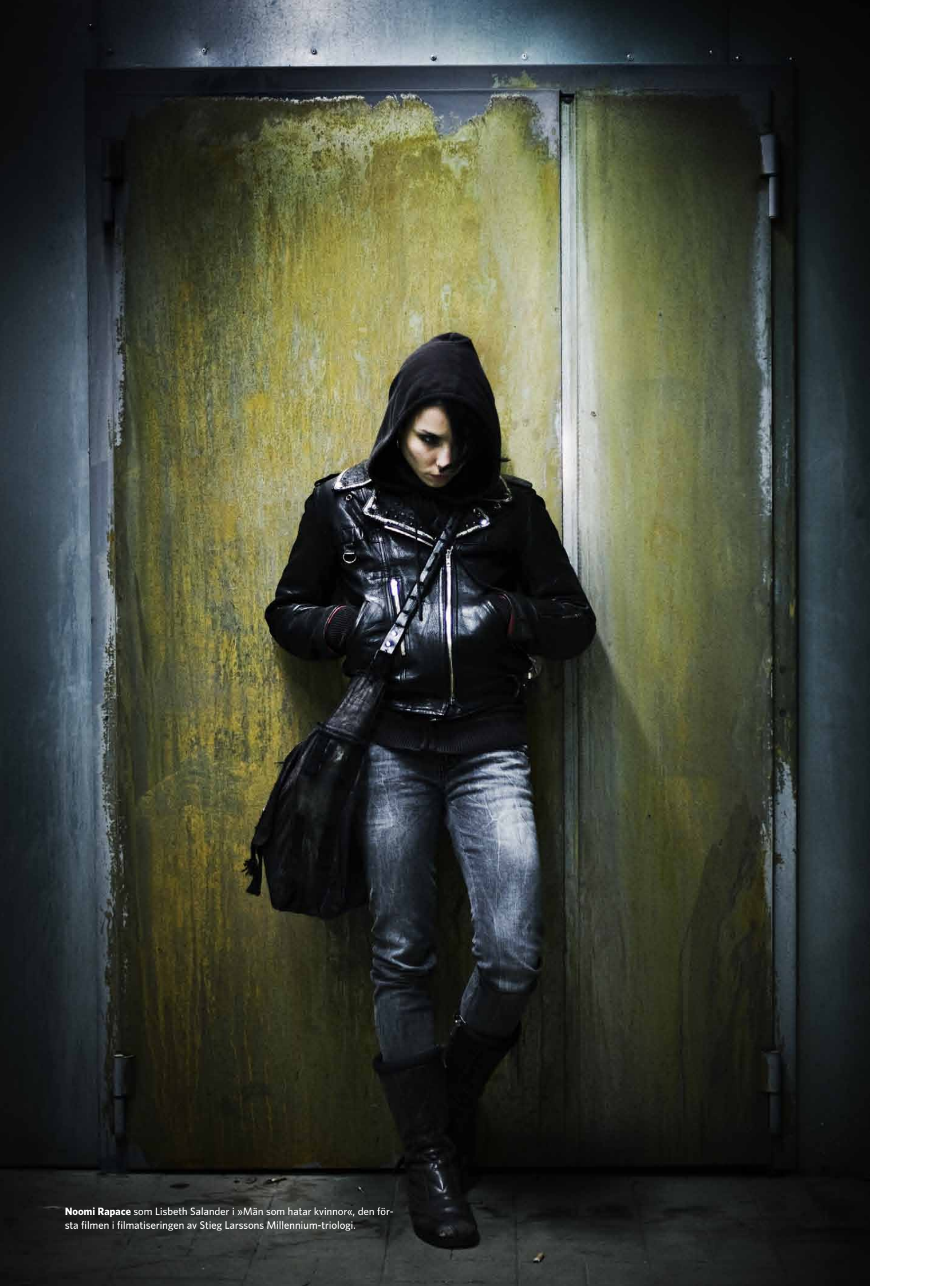
Noomi Rapace som Lisbeth Salander i »Män som hatar kvinnor«, den första filmen i filmatiseringen av Stieg Larssons Millennium-triologi.