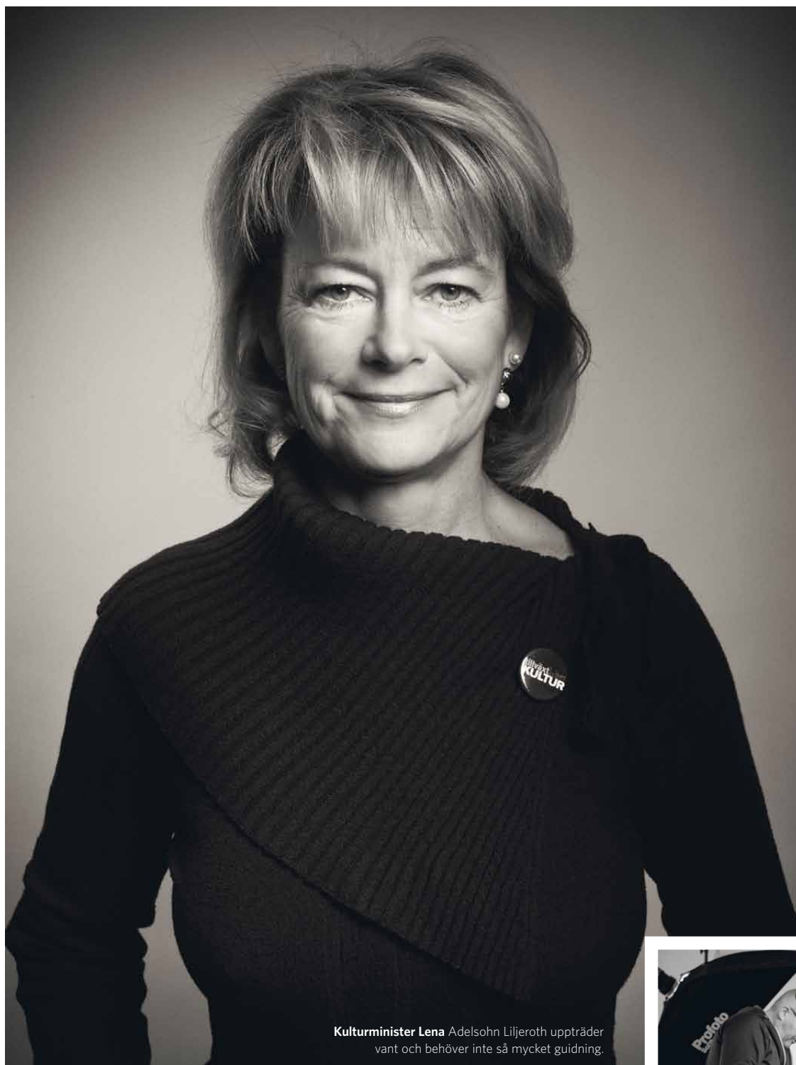
Kulturminister Lena Adelsohn Liljeroth uppträder vant och behöver inte så mycket guidning.