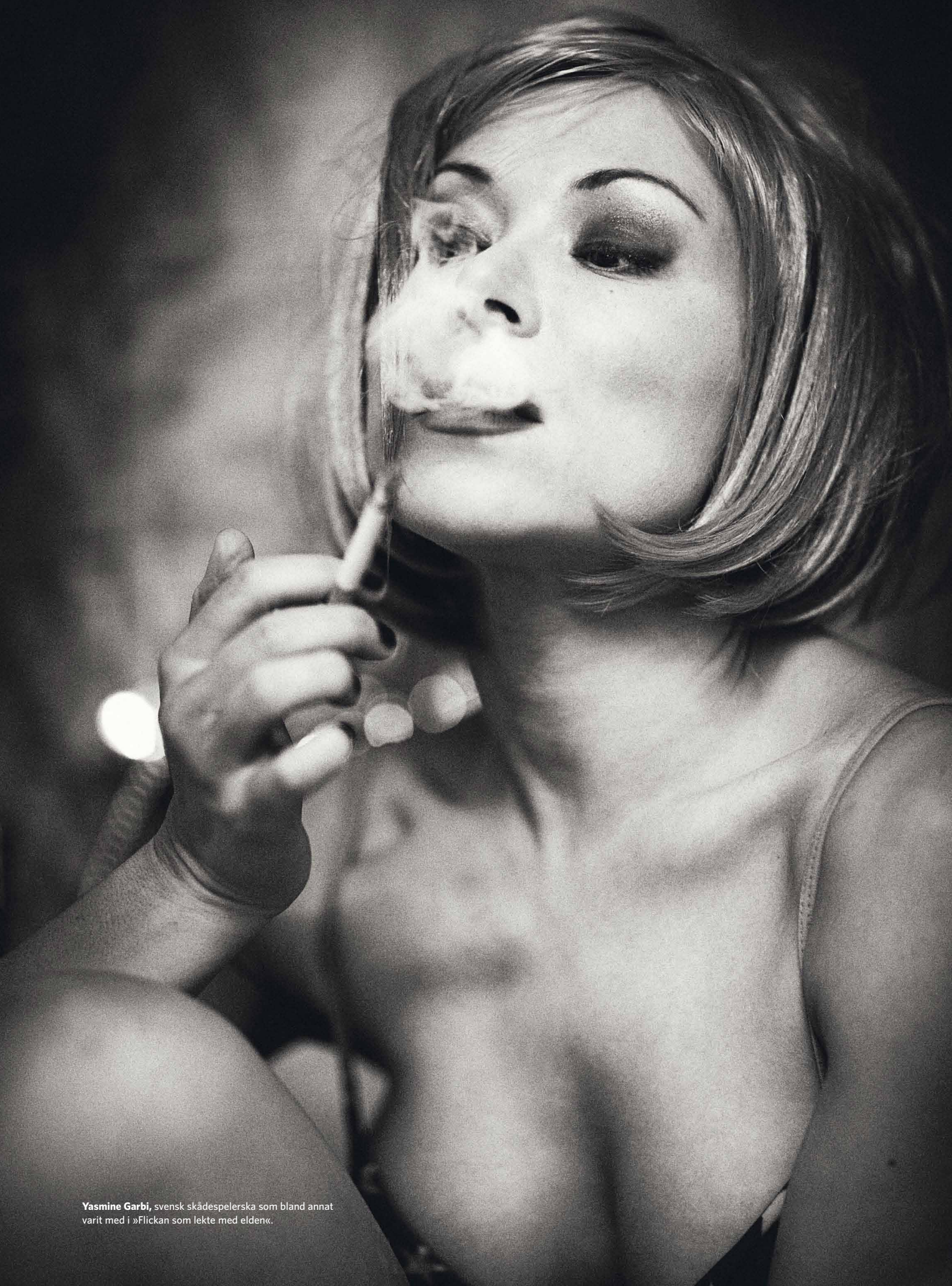
Yasmine Garbi , svensk skådespelerska som bland annat varit med i »Flickan som lekte med elden«.