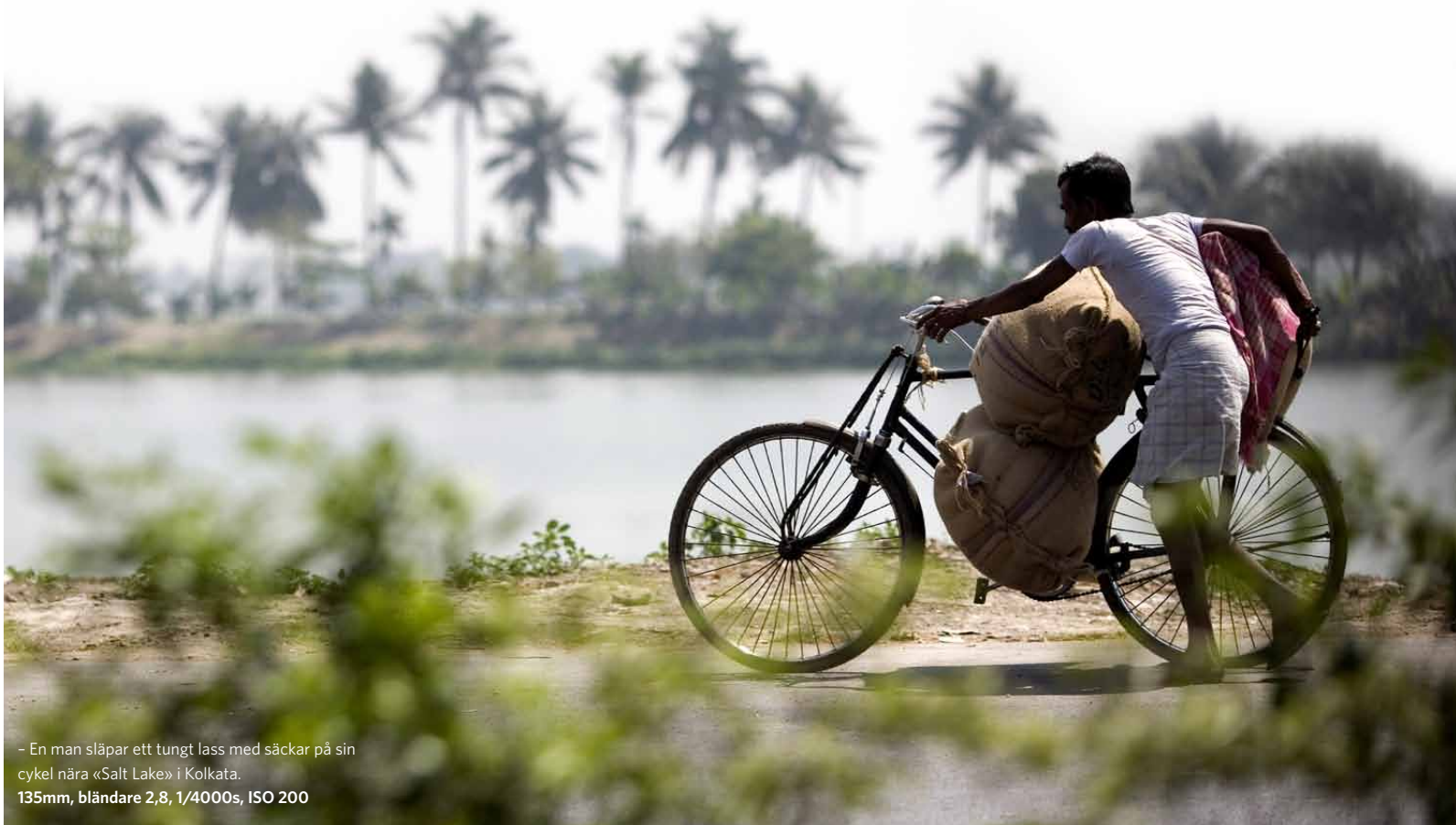
- En man släpar ett tungt lass med säckar på sin cykel nära «Salt Lake» i Kolkata. 135mm, bländare 2,8, 1/4000s, ISO 200