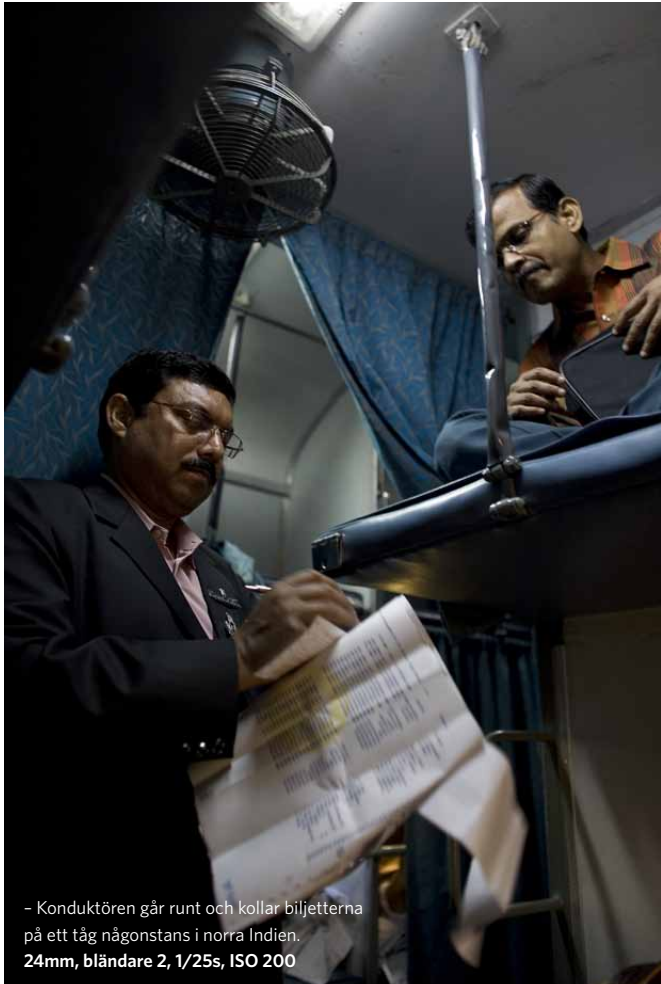
- Konduktören går runt och kollar biljetterna på ett tåg någonstans i norra Indien. 24mm, bländare 2, 1/25s, ISO 200