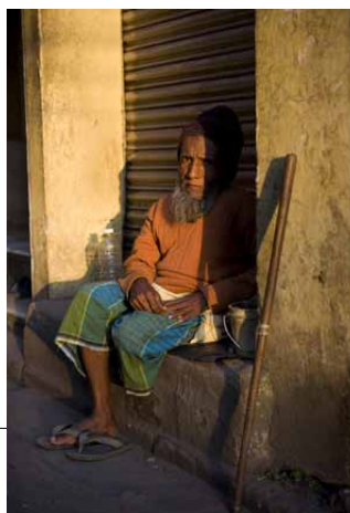
- En muslimsk man tigger utanför en moské i centrala Kolkata. 50mm, bländare 3,5, 1/400s, ISO 400