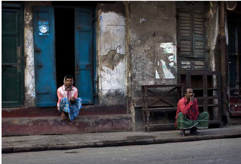
- Två morgontrötta herrar sitter och vaknar till längs en gata i Kolkata. 50mm, bländare 3,2, 1/250s, ISO 400