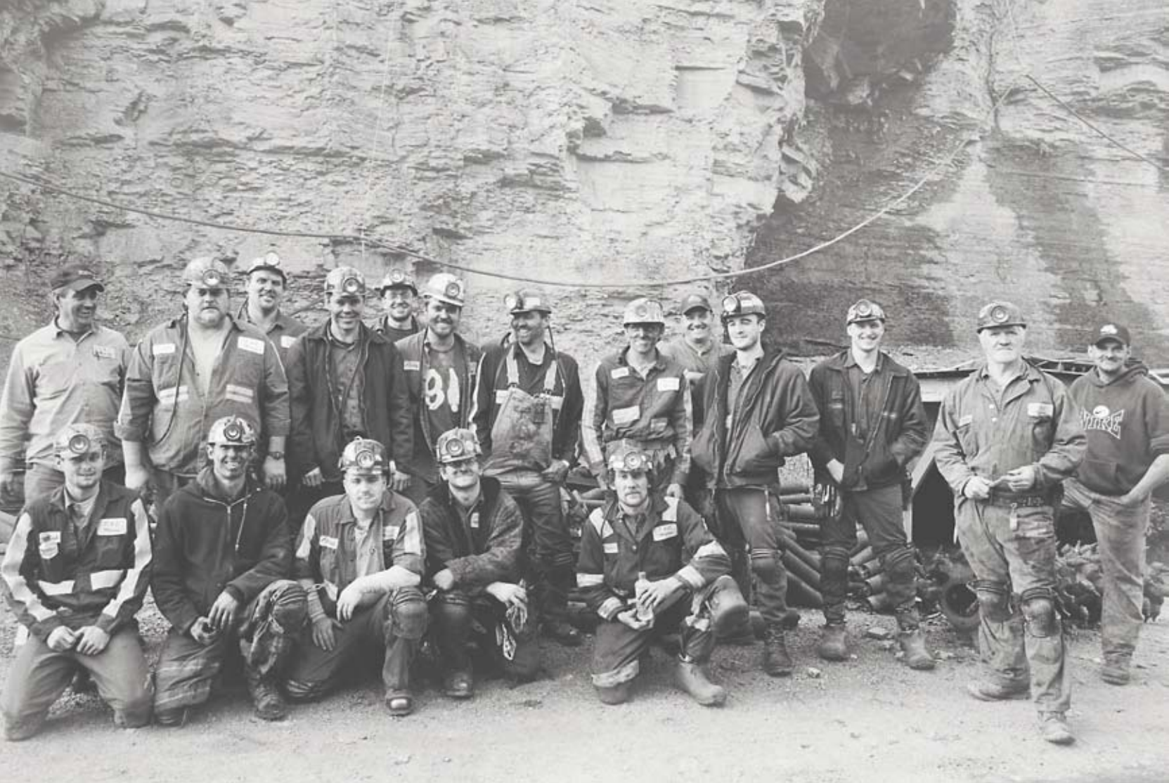
Gruppfotot är från 2006, men skulle lika gärna ha kunnat vara 50 år gammalt. Inte mycket har förändrats i den lilla staden S:t Charles och Hannah arbetade mycket med att fånga känslan av tidlöshet i bilderna.

aktig hinna över en del av bilderna. Egentligen är det bara kläderna som avslöjar att bilderna inte är tagna för länge sedan.