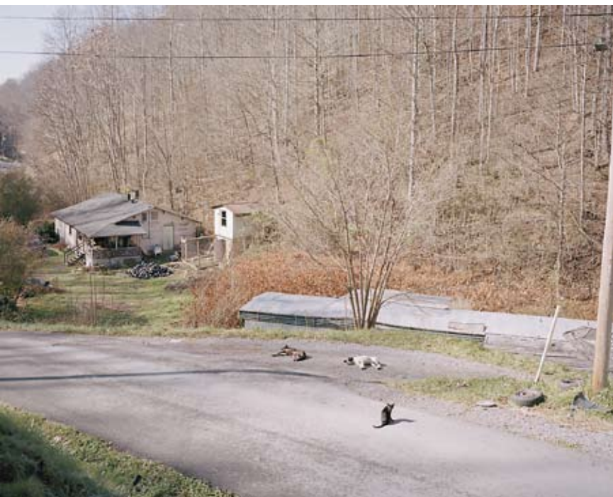
Miljöbilder på den vackra naturen i Virginia, Usa, varvas med porträtt.