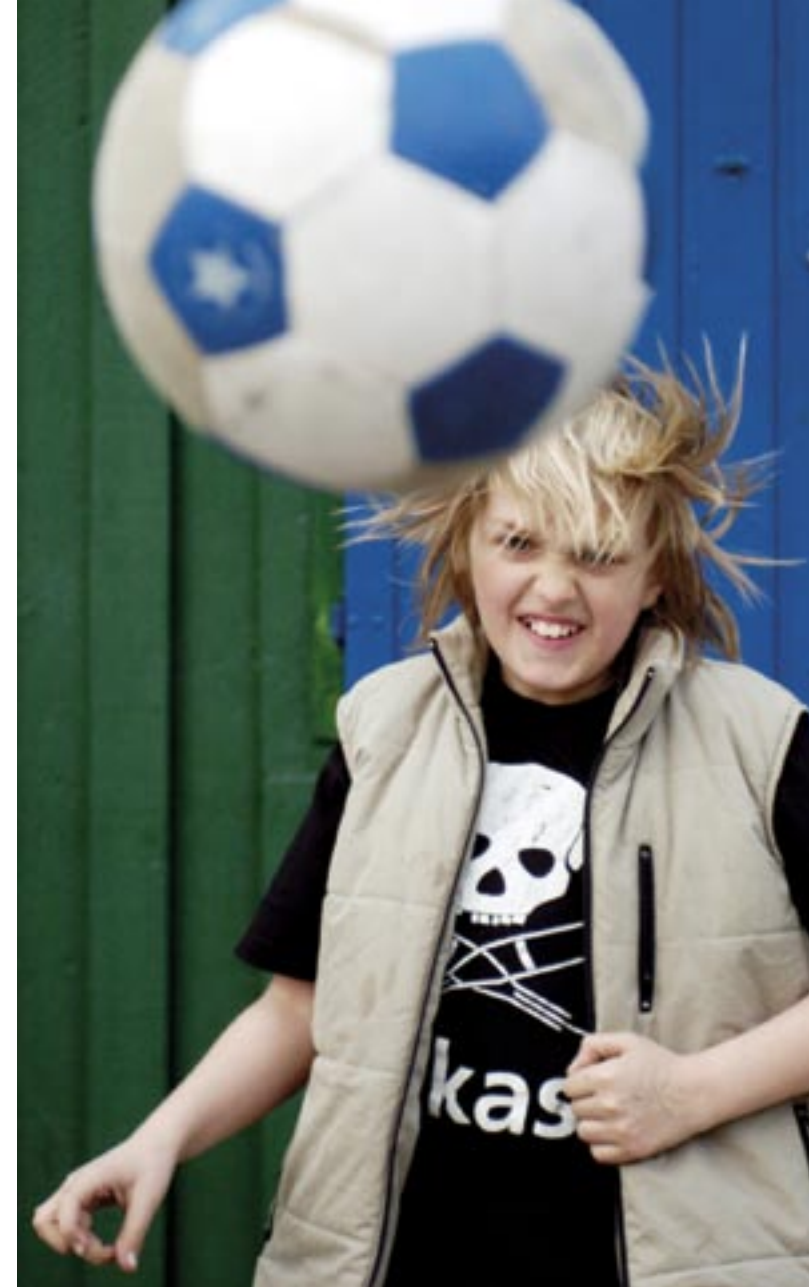
Att ha uppställda gubbar i kostym på bild är illa. Uppställda ungdomar som tittar osäkert in i kameran är värre. För så är de ju inte i verkligheten.

• Det oväntade perspektivet. I vårt vardagsseende tittar vi inte särskilt ofta på saker och ting med en förgrund i blickfånget. Om man till exempel tar en bild med kameran precis bakom en kaffekopp och visar huvudmotivet genom koppens öra får vi se verkligheten ur ett pysslingperspektiv.