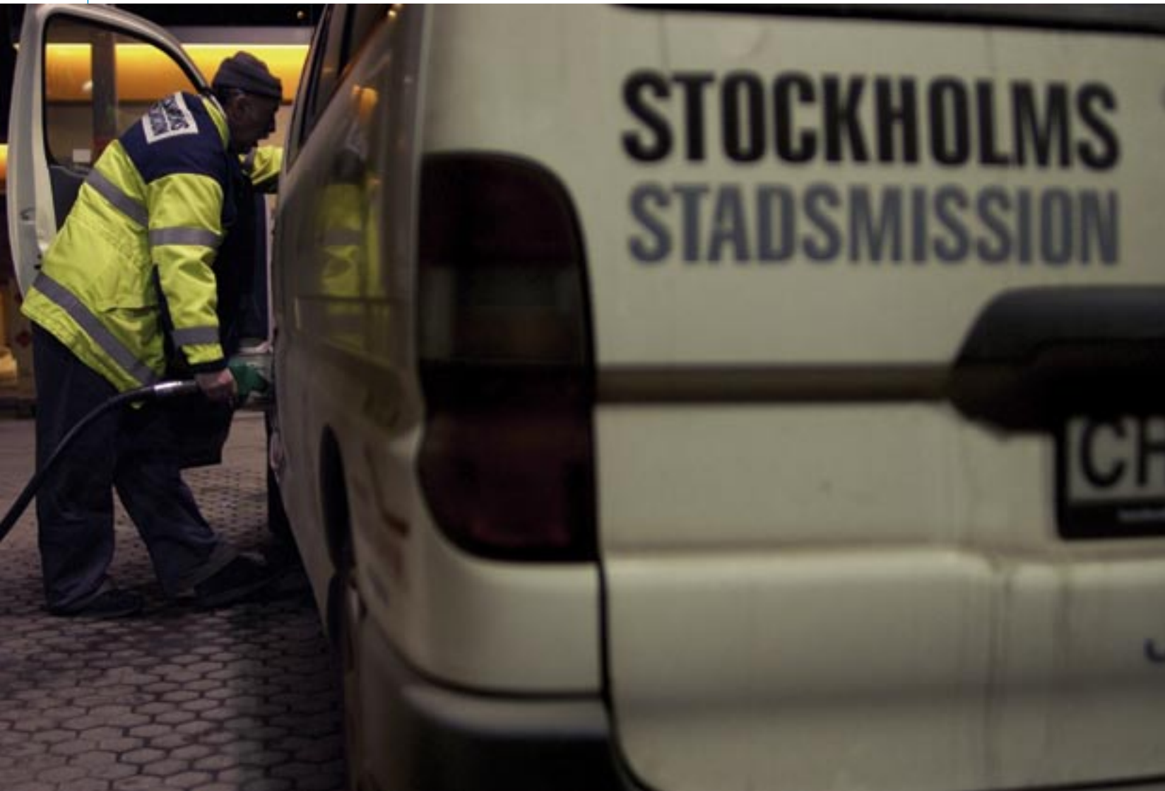
Nattskift på Stockholms stadsmission. Här ville jag göra mannen liten i bild samtidigt som bilytan i övrigt inte skulle stjåla för mycket uppmärksamhet.