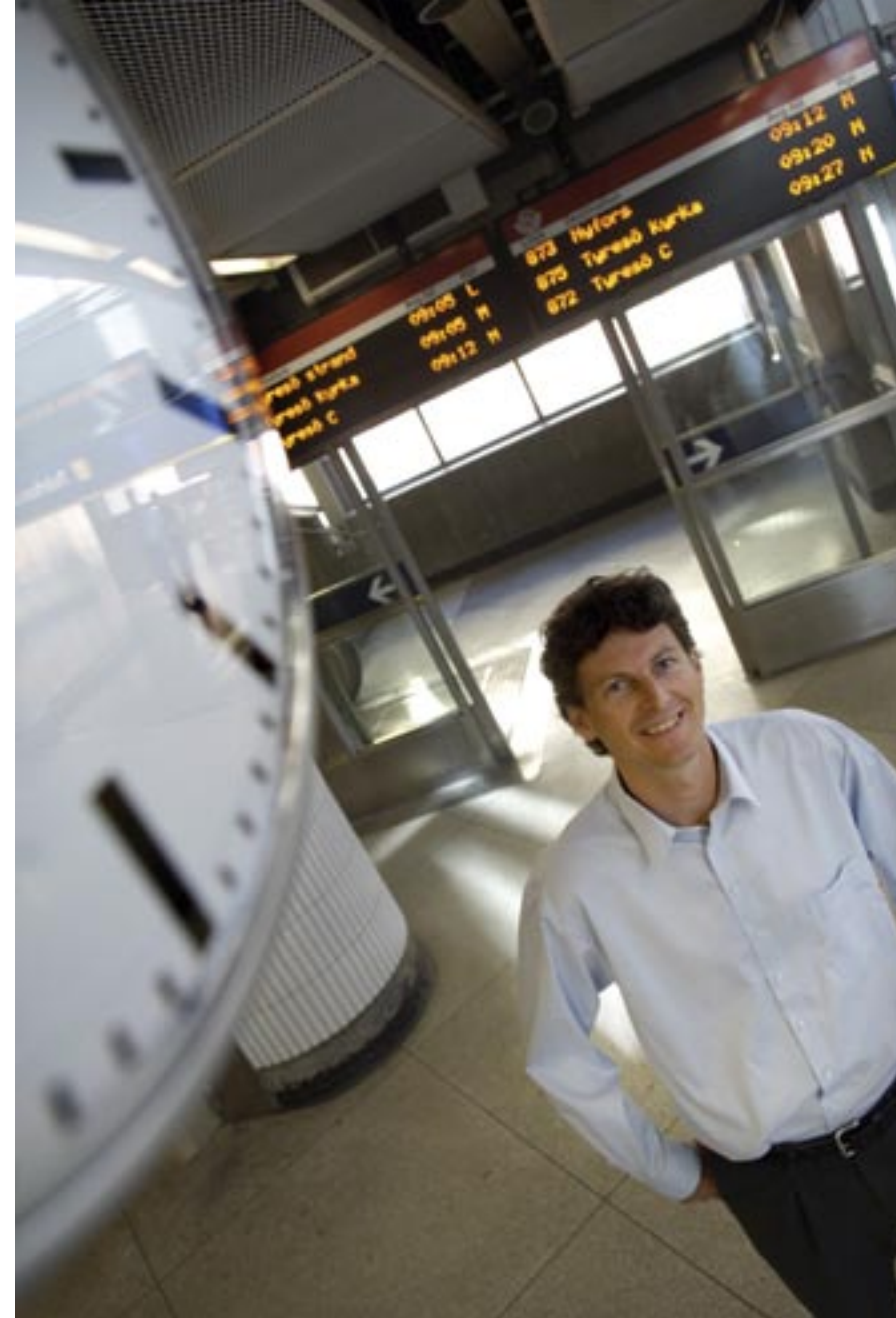
Här är ett typiskt, trevligt koncerntidningsporträtt. Förgrunden ger både djup och en antydning om att artikeln handlar om tidtabeller.

Jo, en sak till. Ha gärna alltid med dig en stor dagstidning i kameraväskan när du är ute på uppdrag. Dels har du något att läsa om du måste vänta, dels kan du använda den som skydd för knän och armbågar om du måste gå ner på marknivå för att få till din bild.