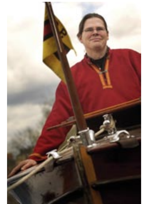
Det är svårt att få med en hel båt i ett porträtt utan att personen blir en bisak. Men genom att lägga typiska båtdetaljer i förgrunden kan man ändå berätta något om miljön samtidigt som fokus ligger på personen.

det innebär ju att det tar lite längre tid också.