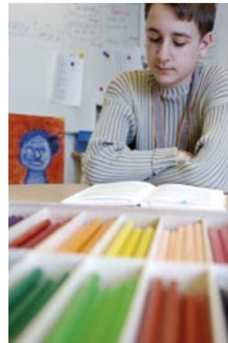
Det här är en riktig klassiker. Det är svårt att fotografera folk som läser eller skriver i böcker, men den låga kameravinkeln gör att färgerna i förgrunden ger bilden extra skjuts.