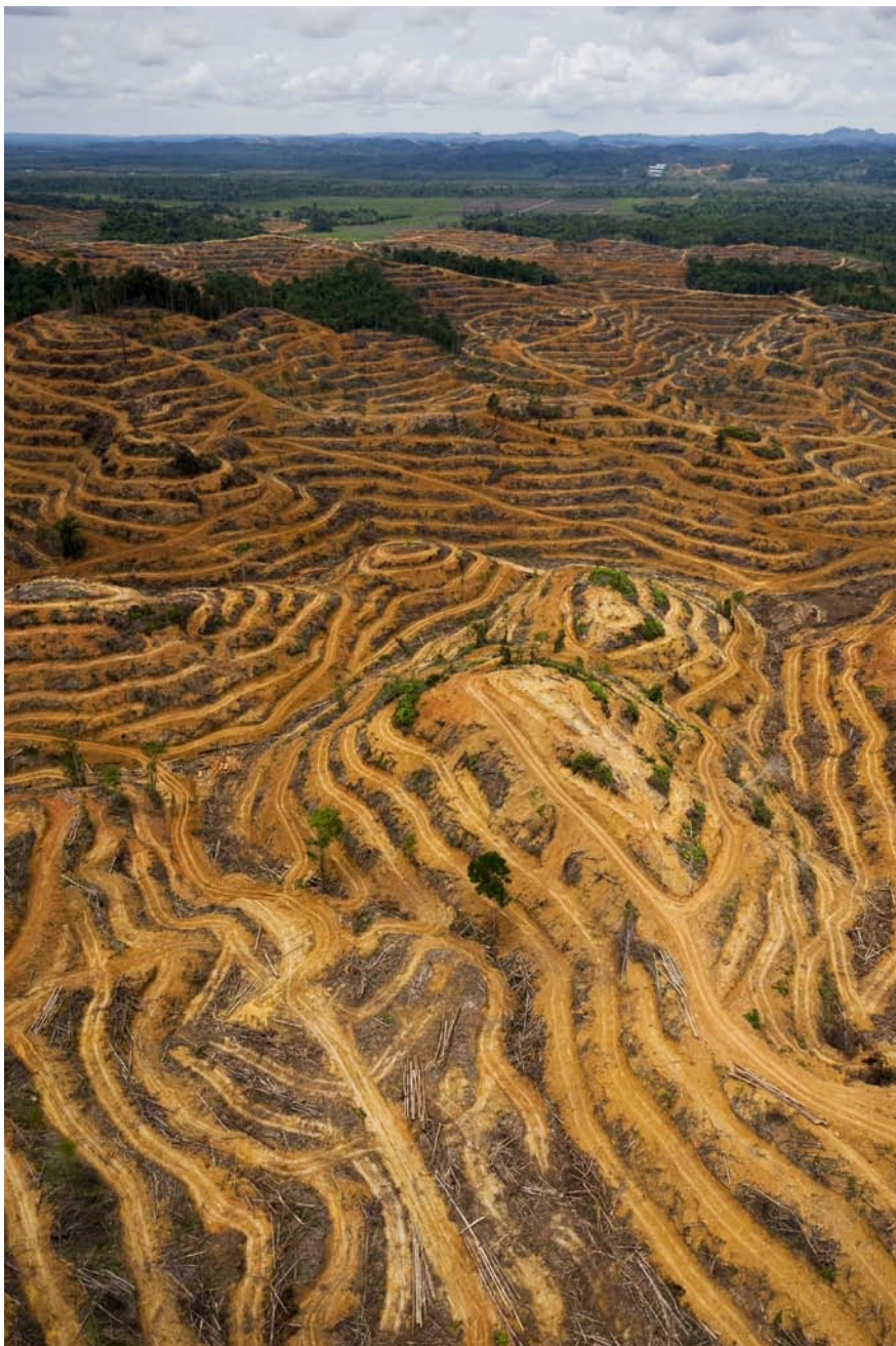
Avverkningsområde där Caterpillars precis har avslutat terrasering för att ersätta en av jordens rikaste miljöer med en monokultur, oljepalm. Sarawak, Borneo