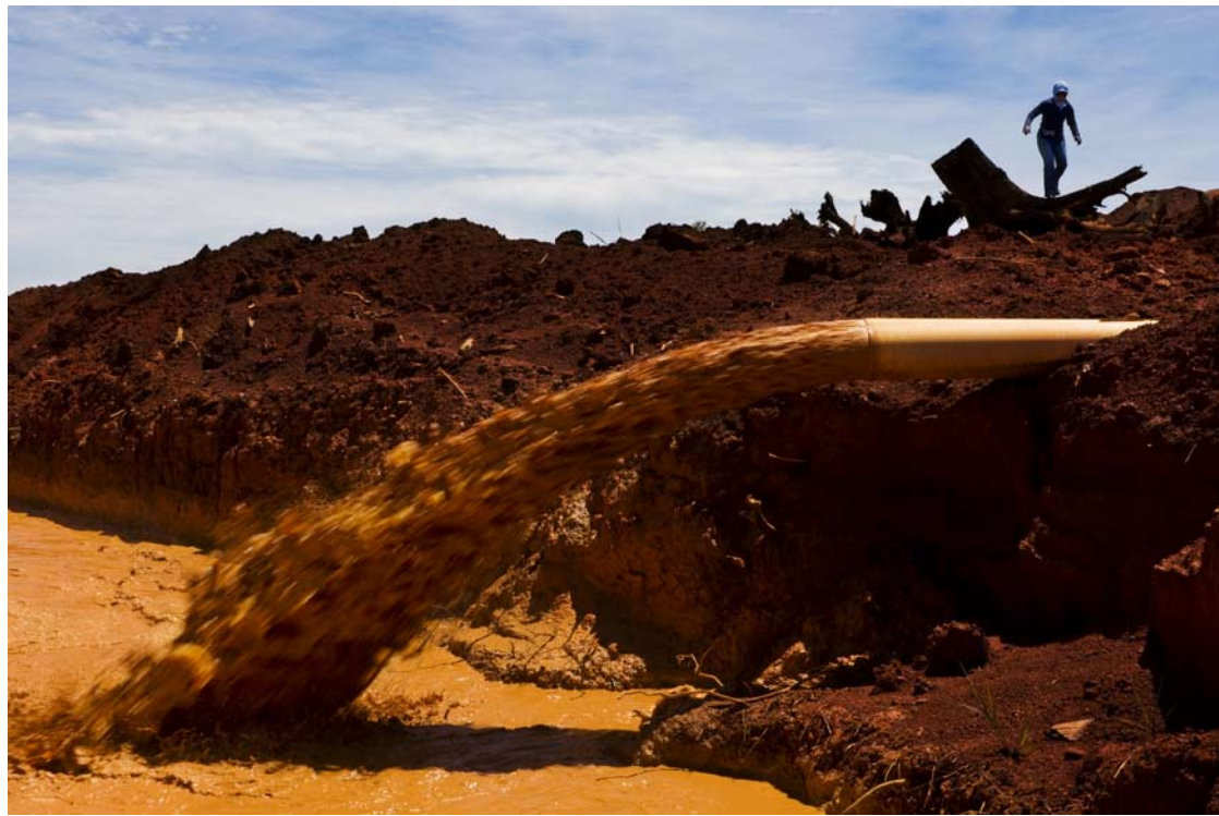
Dessy Ratnassari arbetar i ett projekt med att inventera illegal exploatering av regnskogsområden, Västra Kalimantan, Indonesien.