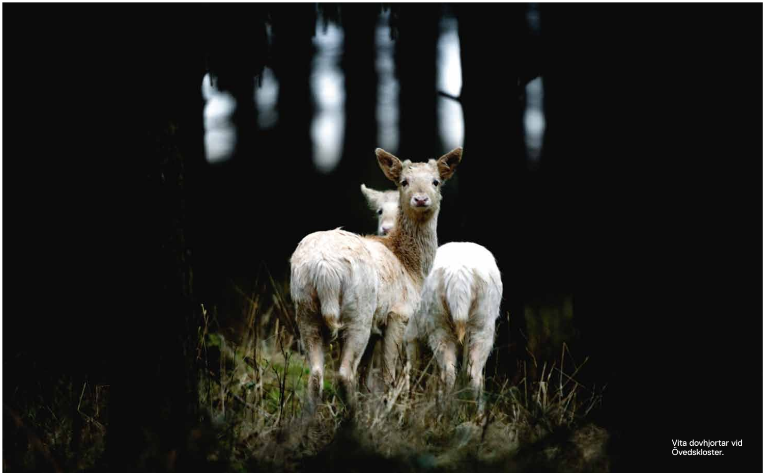
Vita dovhjortar vid Övedskloster.