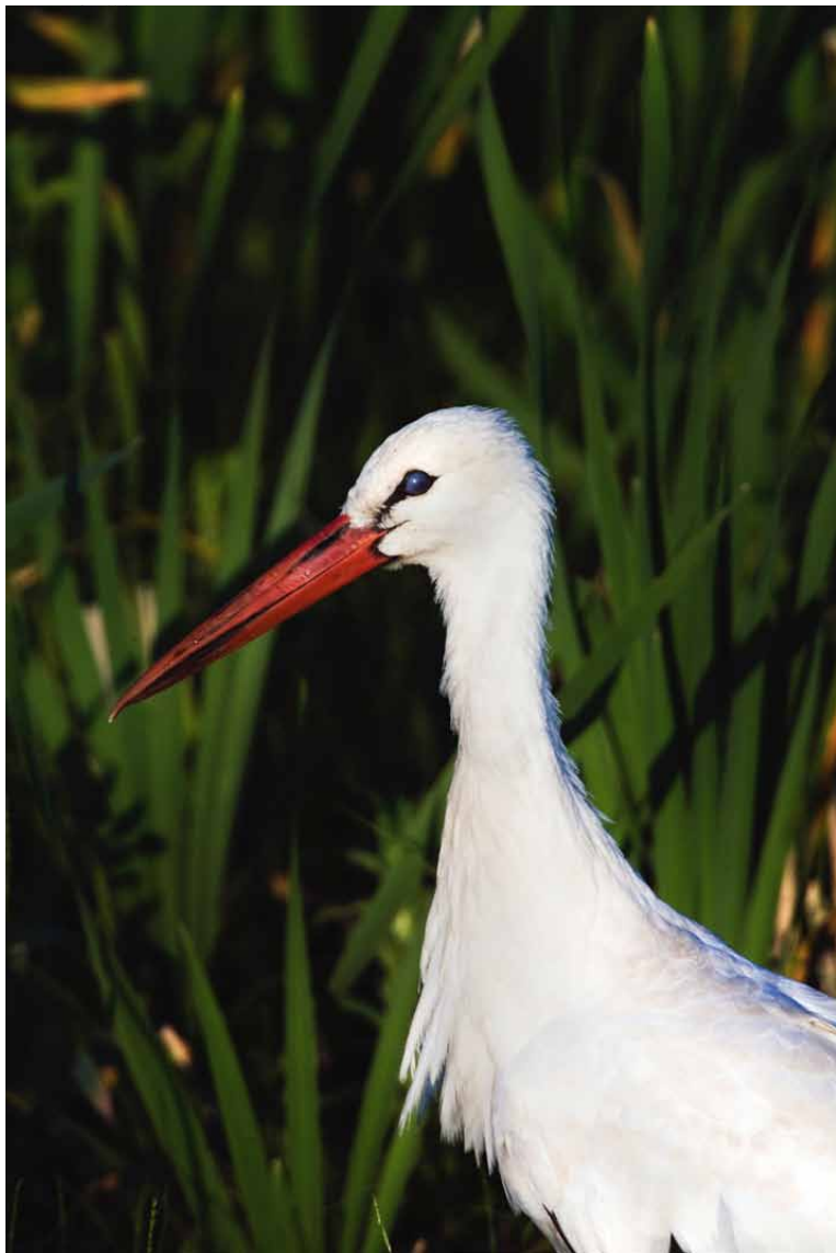
Storcken har komit tillbaka till Skåne. Här syns den vid Vombsjön.

Han fotograferar som regel med manuell exponering i morgonljuset och med automatik tillsammans med exponeringslås under dagen.