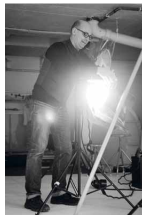
Att hitta rätt uttryck i bilden är det som tar tid. När ljuset och utsnittet stämmer tar det inte många minuter innan jobbet är klart.

Just LP blir under intervjun lite av en visuell synonym med Mats. Kvalité. Mycket känsla och stil, och alltid med känslan i fokus.