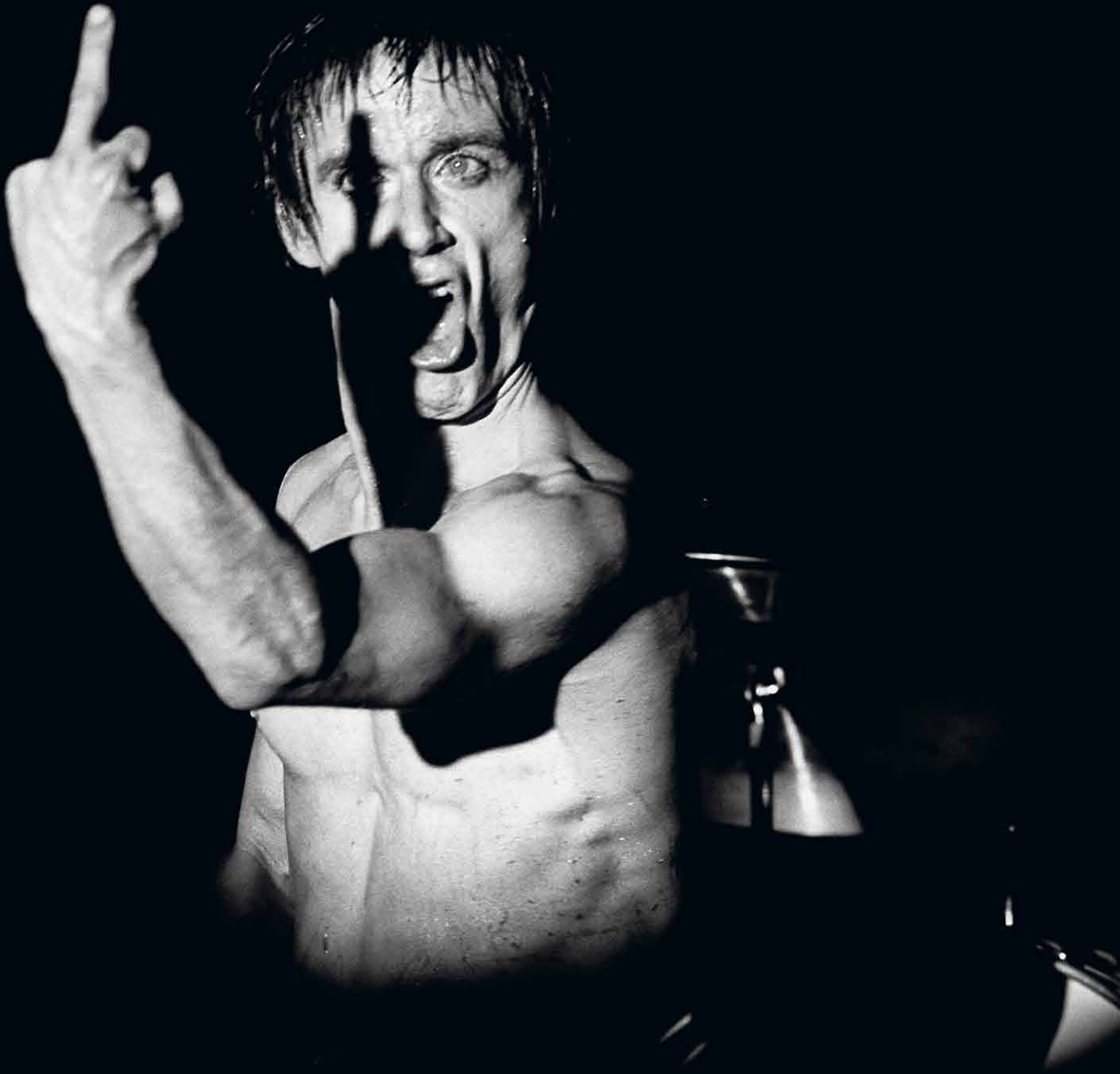
Iggy Pop, Köpenhamn, 1978.