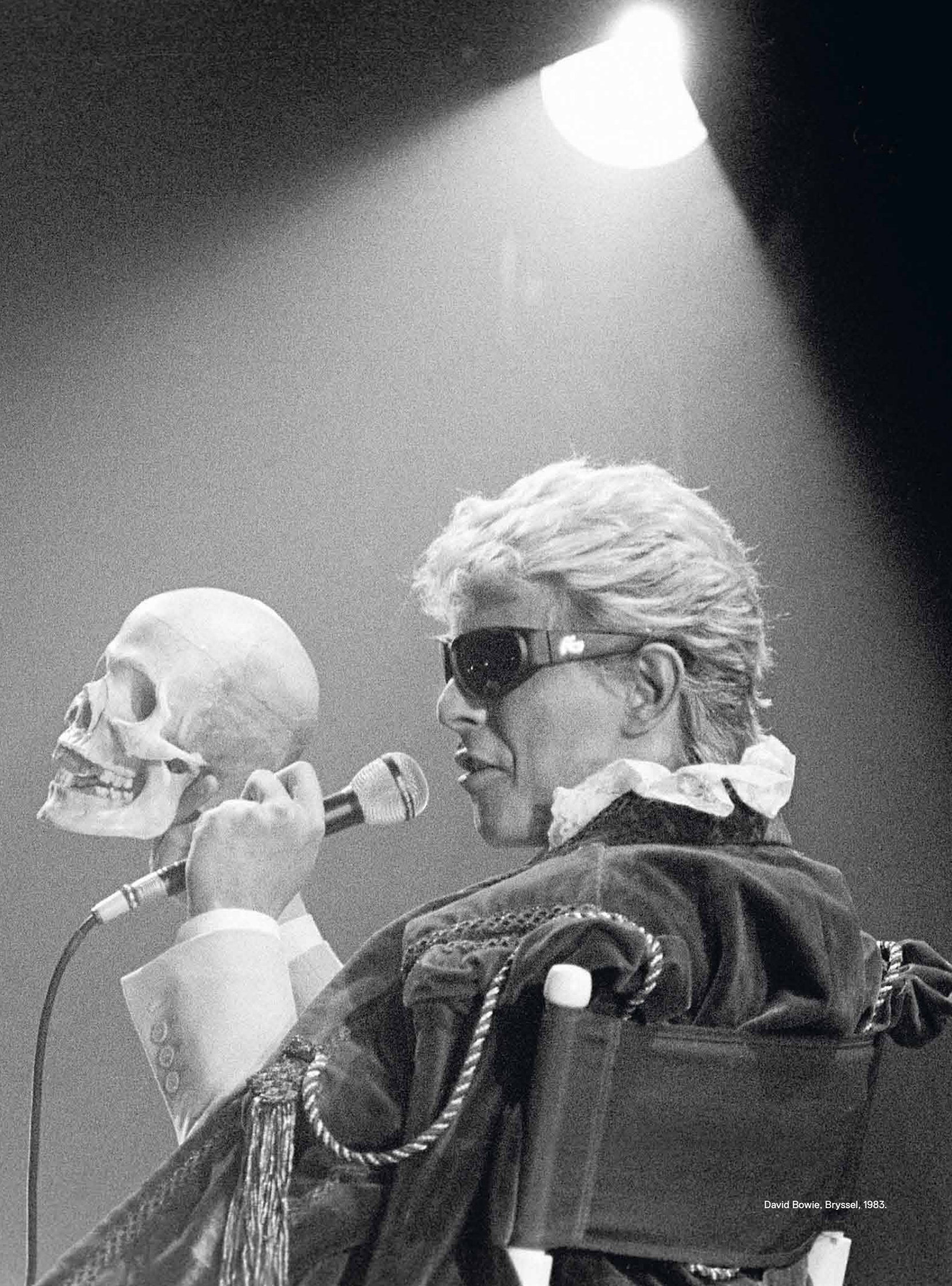
David Bowie, Bryssel, 1983.