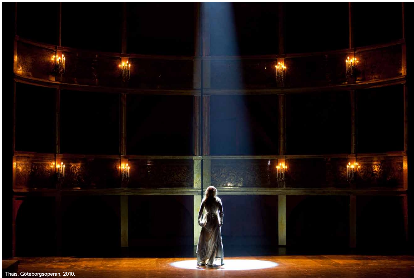
Thais, Göteborgsoperan, 2010.