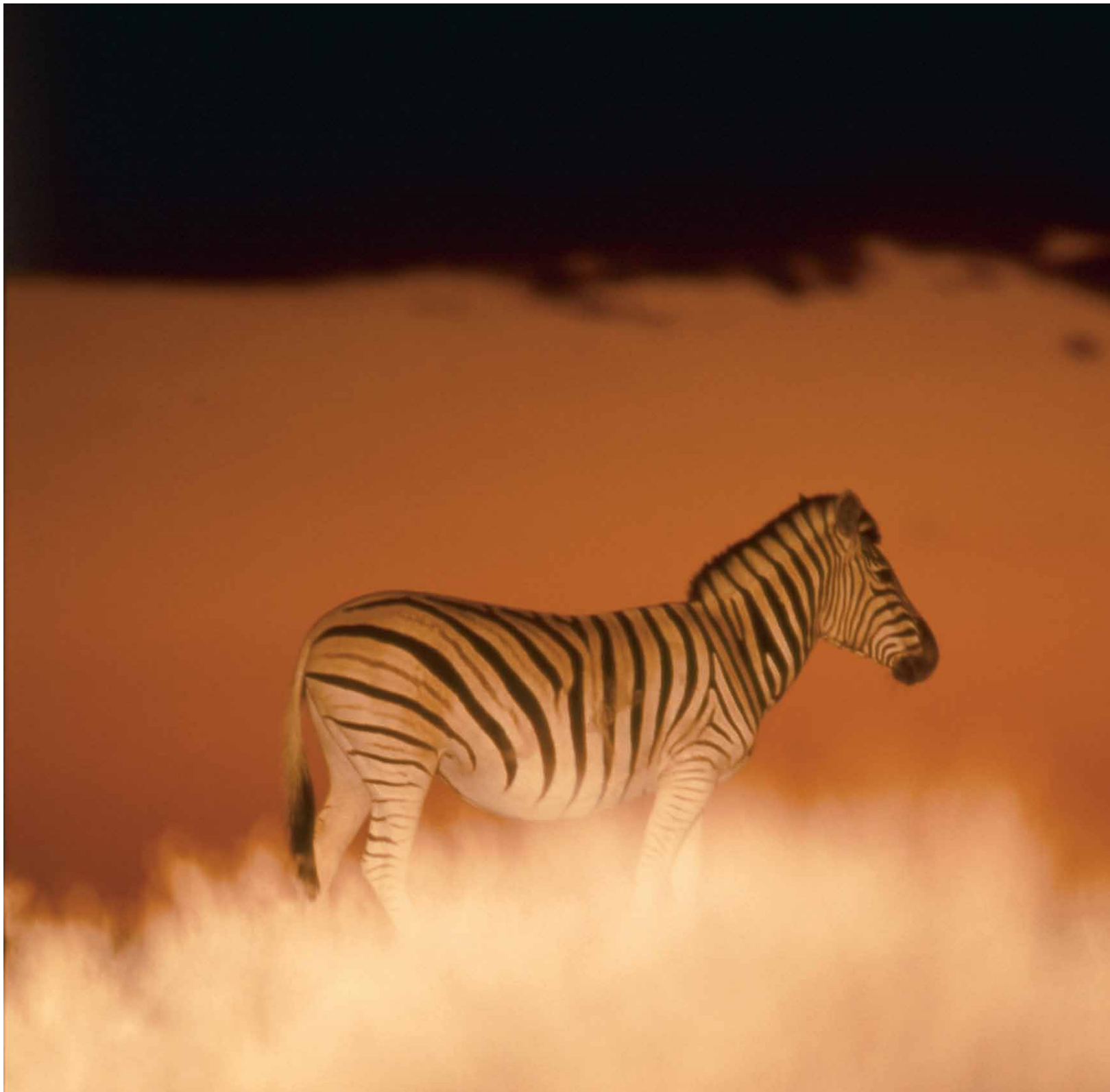
En Zebra poserar framför bilens strålkastare med en afrikansk skymningshimmel i bakgrunden. Etosha NP, Namibia, november 2002.