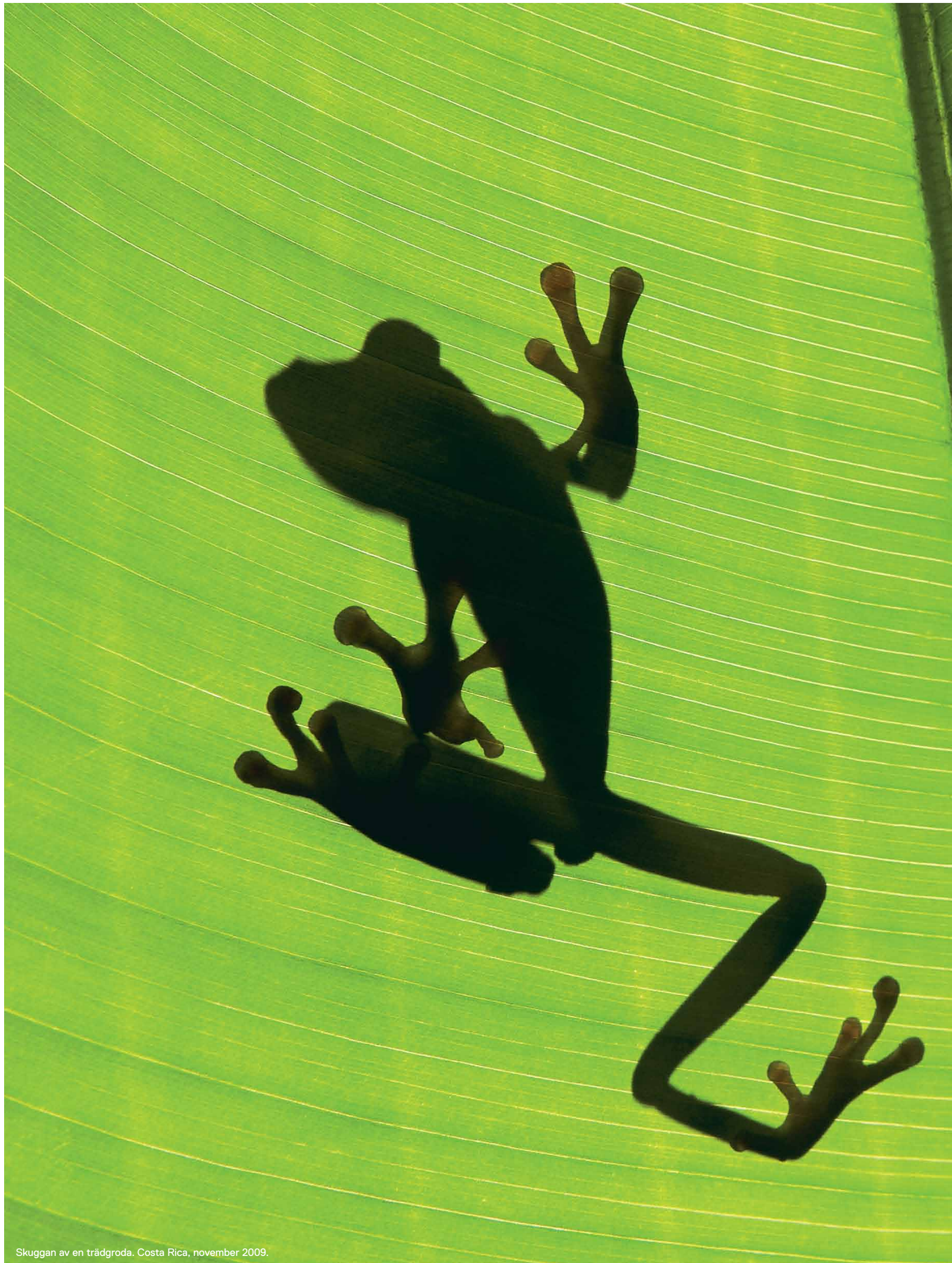
Skuggan av en trädgroda. Costa Rica, november 2009.