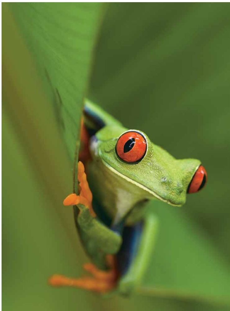
Rödögd trädgroda, Costa Rica, november 2009.

–Man väntar ju på att det ska hända någonting häftigt och ofta gör det om man har tålamodet. Det går inte att sitta hur länge som helst, men med tiden blir det oftast bra resultat. Och så ska man ha tur med väder och vind.