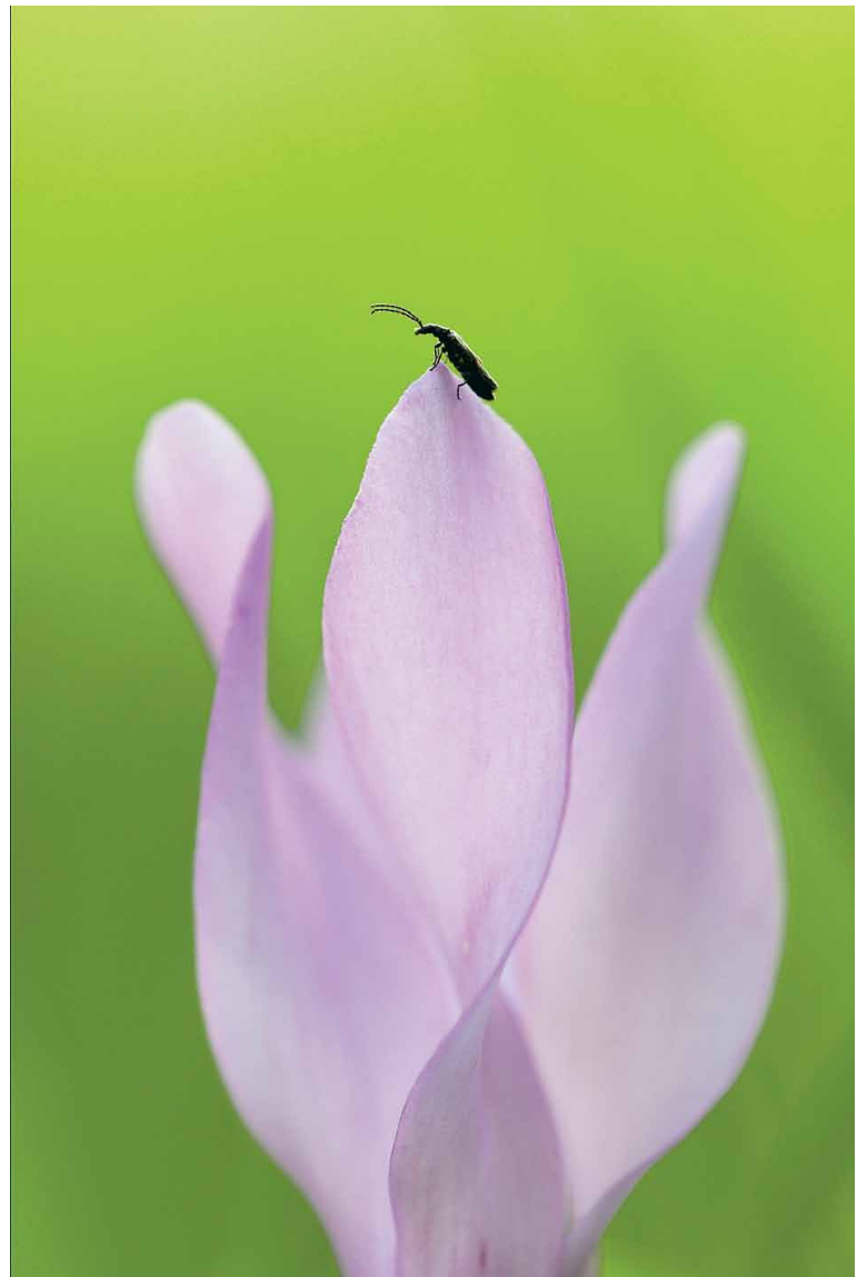
Cyklamen fotograferad på Cypern i april förra året för Wild Wonders of Europe.

DET FINNS ETT GRYMT BILDFLÖDE OCH MAN FÅR FÖRSÖKA FOTOGRAFERA NÅGONTING NYTT. DET ÄR INTE LÄTT, MEN MAN FÅR GÅ SIN EGEN VÄG OCH FÖRSÖKA ATT INTE TÄNKA SÅ MYCKET PÅ OMGIVNINGEN. Peter Lilja