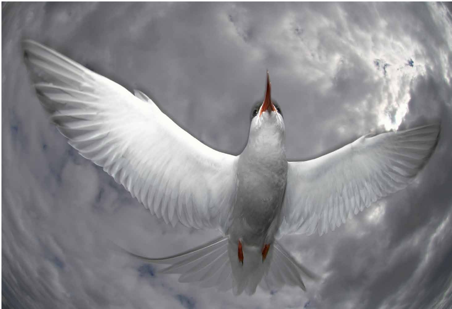
Silvertärnan gör ett utfall mot fotografen för att markera att detta är hans revir. Täme, Västerbotten, juni 2007.