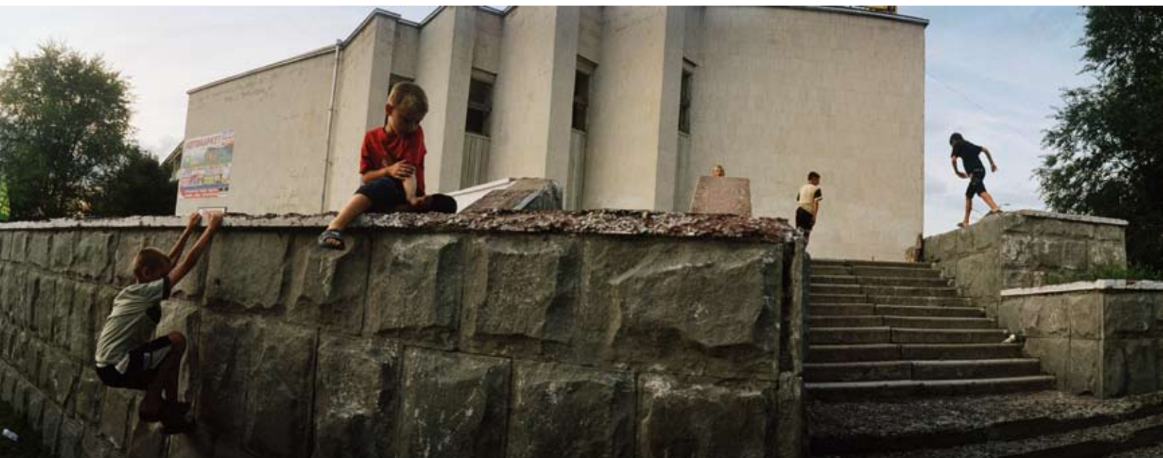
Dubasari, Transnistrien 2006