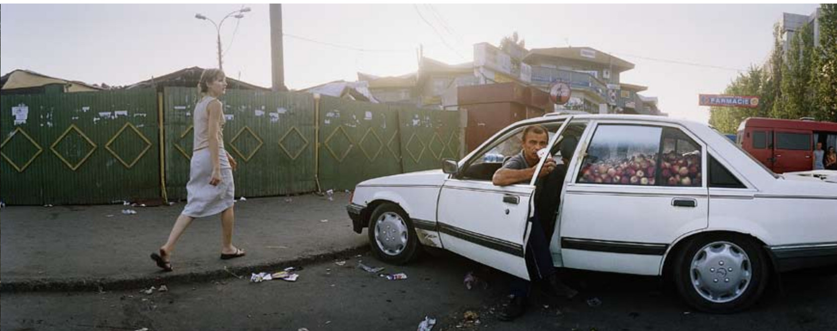
Chisinau, Moldavien 2006

– Jag står inte ut med bilder som är för enkelspåriga. Då blir jag uttråkad redan innan jag tagit fotot. Livet är för komplext och för att inte bara bekräfta fördomar måste man hitta det trovärdiga, någon irrationell detalj som överraskar i bilden. Frågor är mer intressanta än svar. ■