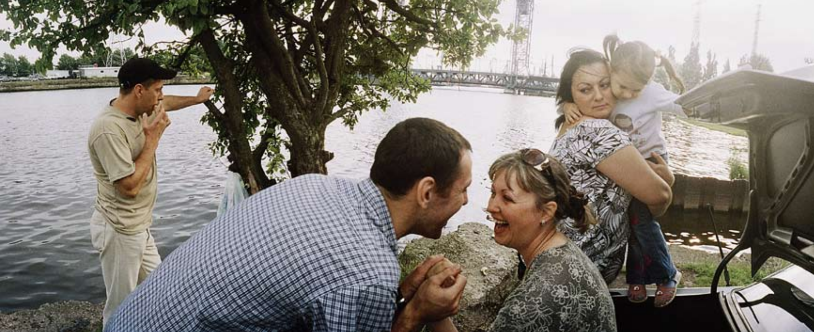
Kaliningrad , Ryssland 2007