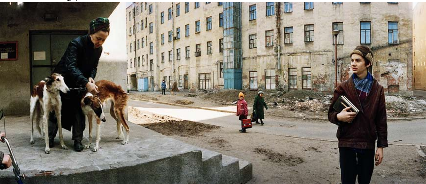
Sankt Petersburg , Ryssland 1993