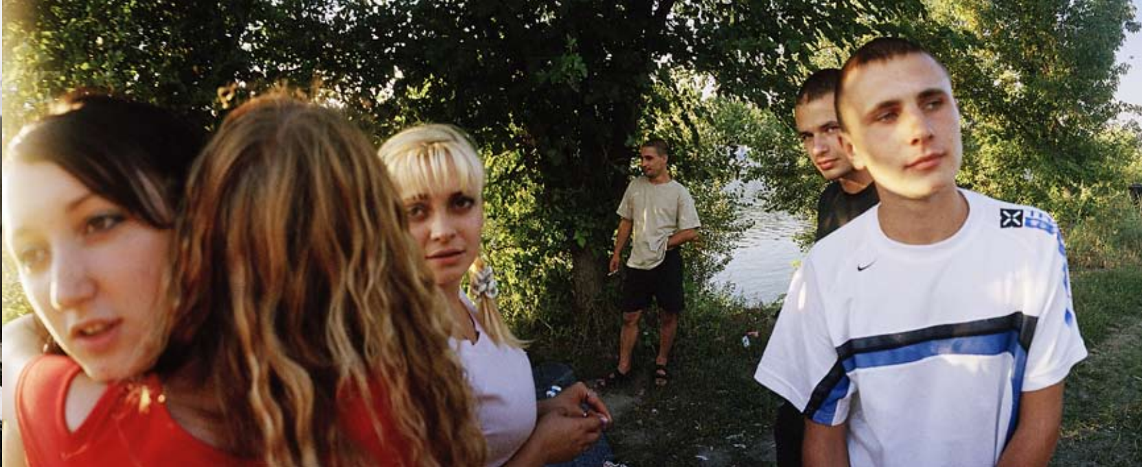
Tiraspol , Transnistrien 2006