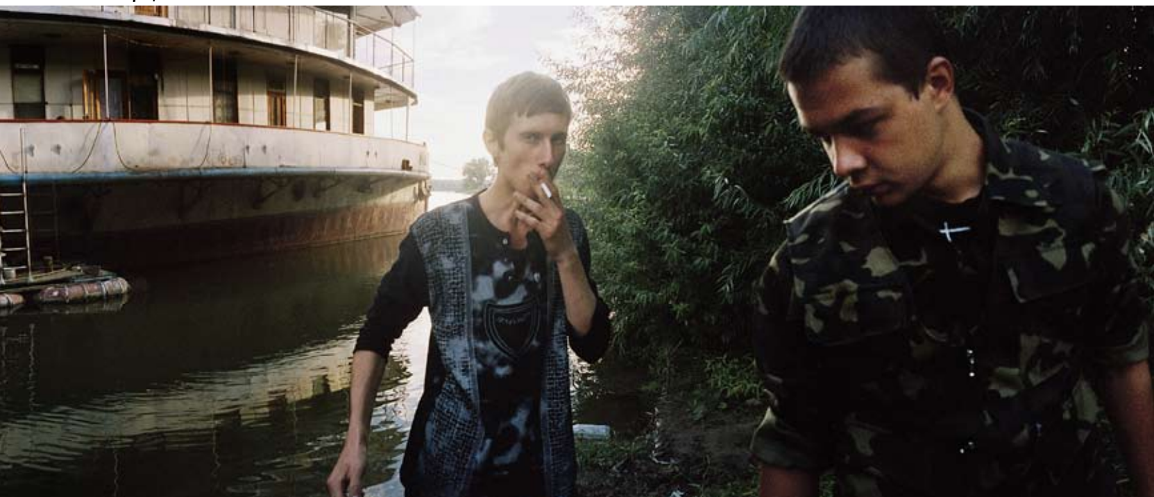
Tiraspol , Transnistrien 2006

Med sig till Ryssland hade han en japansk panoramakamera. I det formatet kan flera scener utspela sig och där kan saker vara lika mot-