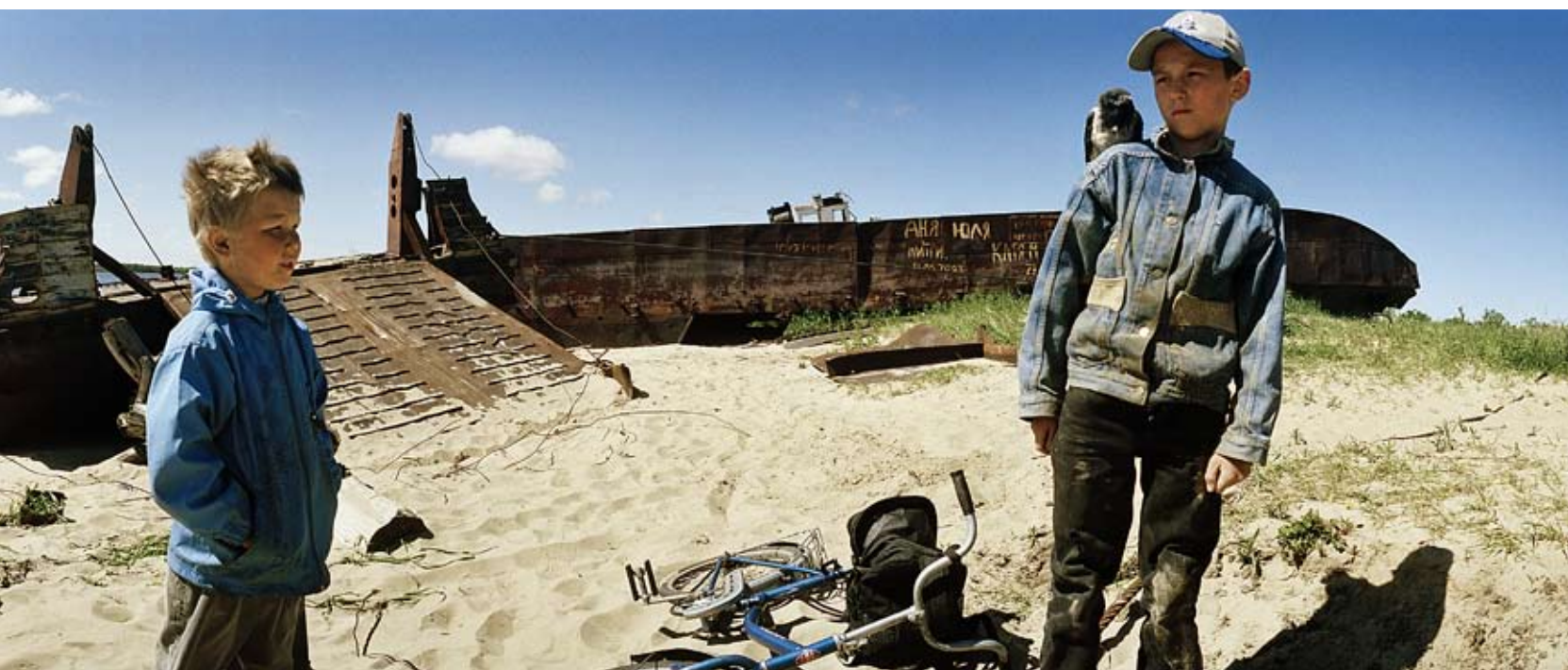
Kegostrov , Arkhangelsk, Ryssland 2005

Resorna i den del av Europa som förut var spärrad av järnridån har gett frilansfotografen Jens Olof Lasthein minnen för livet. Han ser det nödvändiga i att ta ett steg tillbaka från motiven eftersom det man känner igen förblindar. TEXT AMY LAGERMAN