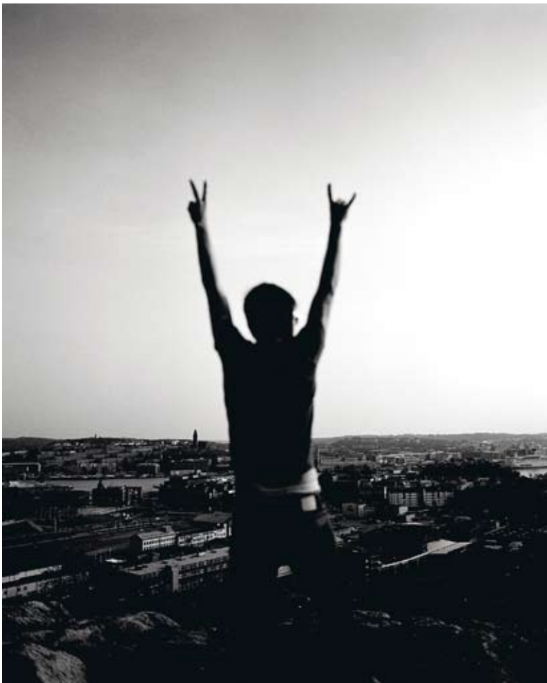
Nudie jeans med Göteborg för fötterna. Enkel, men med oväntat fokus.