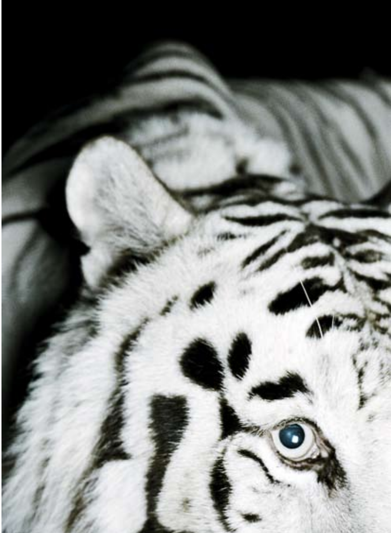
En av de vittecknade bengaliska tigrarna från Eskilstuna Zoo. Bilden fotograferades till Kents skiva Vapen och Ammunition.