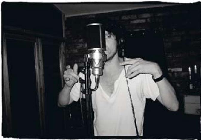
Bilder från studion när Skebokvarnsv. 209 spelades in.

Zoo och ett hundspann i full karriär – foton som prytt omslagen till några av Kents skivor.