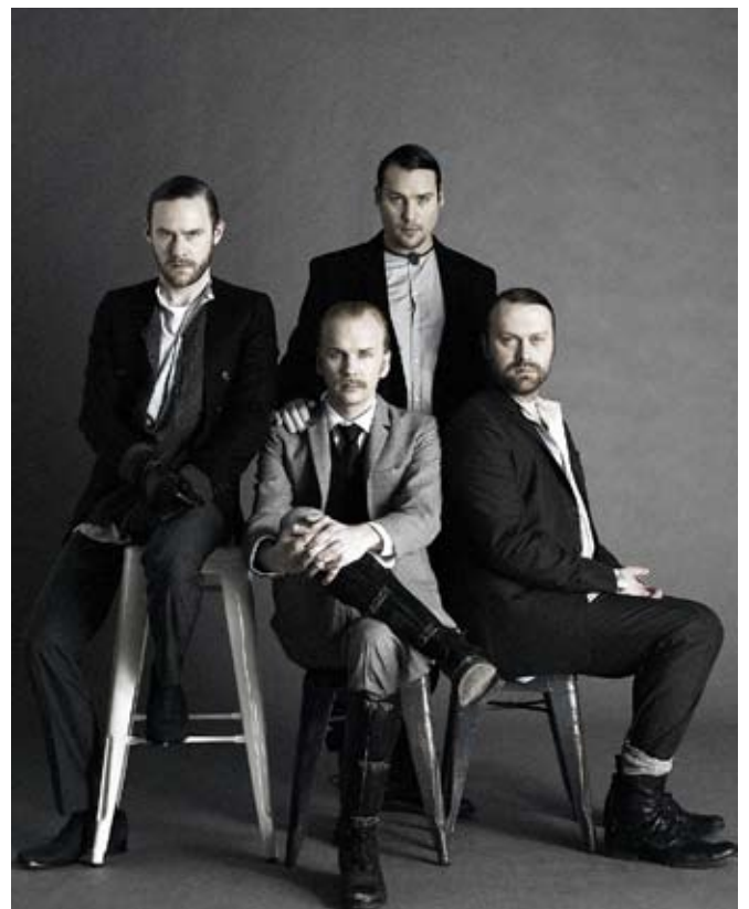
Bandet Kent i en annorlunda tappning.