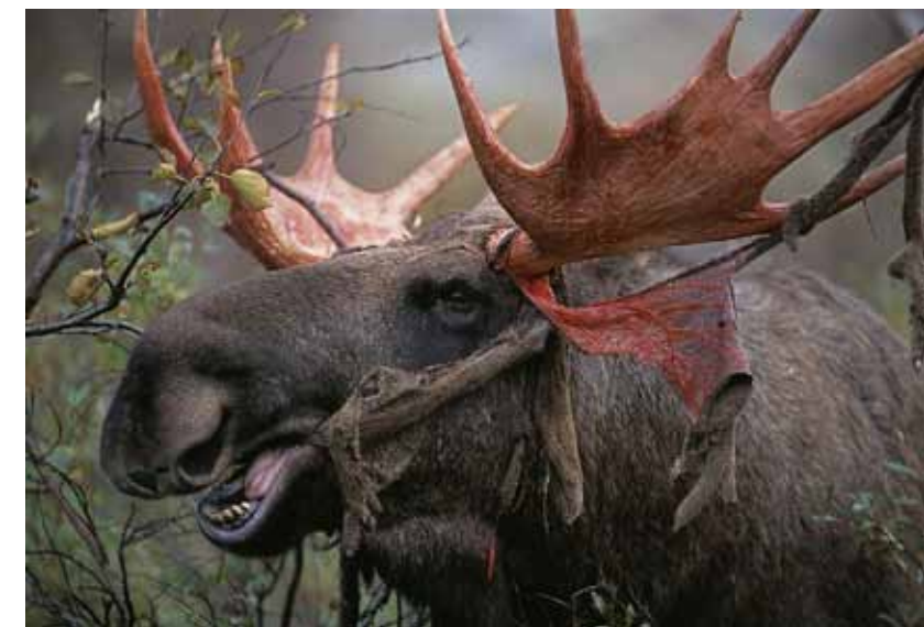
Precis i rätt ögonblick, på rätt sida av ån, i en specifik dal lyckades Staffan ta en unik bild av älgen som tuggar på basthuden från hornen.

Den tjuktjenska gamle mannen mindes hur Sovjetunionen försökte utrota det Sibiriska folket.