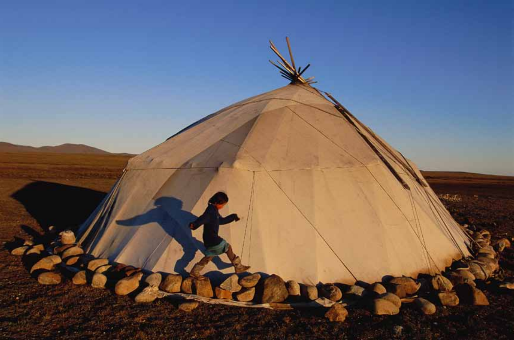
Staffan jobbar med reportagefotografering och värjer sig litet mot att kallas för naturfotograf..

historia. Som föreläsare bjuder han publiken på berättelser från verkligheten, som både är underhållande och lite tragiska. Inkonsekvens är ett återkommande inslag på Staffans föredrag.