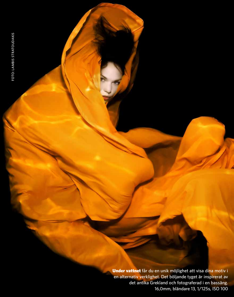
Under vattnet får du en unik möjlighet att visa dina motiv i en alternativ verklighet. Det böljande tyget är inspirerat av det antika Grekland och fotograferad i en bassäng. 16,0mm, bländare 13, 1/125s, ISO 100

Vill du fotografera med tyger bör du välja lätta och tunna material som kan bölja i vattnet. Men kom också ihåg att tyg tynger ner. Var rädd om modellen.