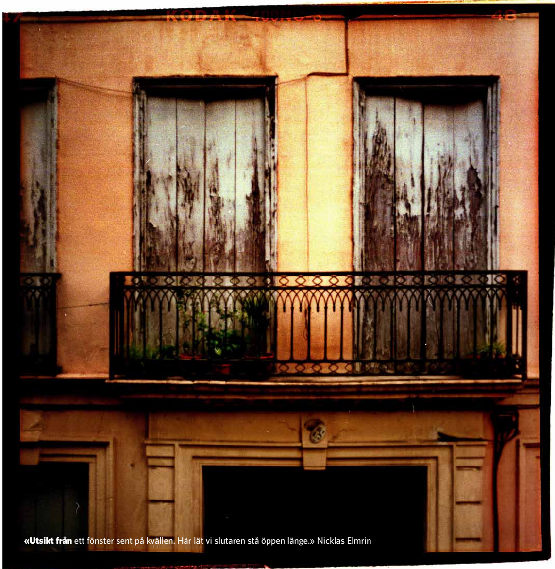
«Utsikt från ett fönster sent på kvällen. Här lät vi slutaren stå öppen länge.» Nicklas Elmrin